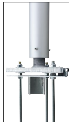
KA-K Flanschswelle mit Sicher- heitsscharnier, Ankerkorb mit Justierbolzen, Stahl feuerverzinkt