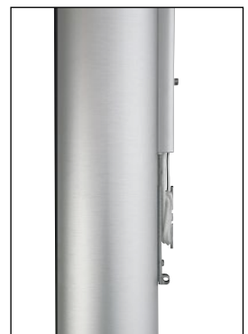
Schließklampe mit PES-Hisseil, offen

Alternativ zu den drehgelagerten Auslegermasten bieten wir starr eingebaute Masten der Serie ZA75, ZA90 und ZA100 mit hissbarem Drehausleger.