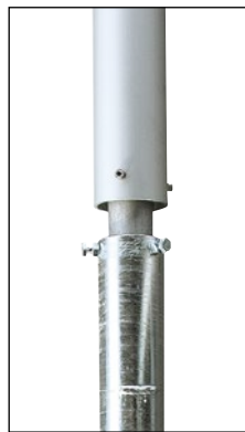
KA-W Steckwelle in Spezialboden- hülse mit Justierschrauben, Stahl feuerverzinkt

Angaben zu den Fundamentgrößen sind nur informativ, verbindliche Fundamentgrößen und Fundamentausbildungen ergeben sich aus dem Fundamentplan, der im Auftragsfall zur Verfügung gestellt wird.