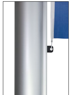
Optional: Fahnenstraffer unverlierbar