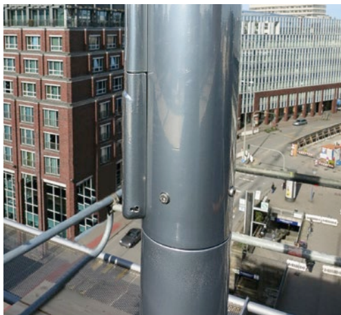
Mastrohr 2-teilig mit Drehlagerung, Fassadenmontage