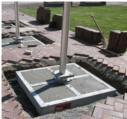
Stahlrahmen zur Fundamentverbreiterung für „schwimmenden“ Einbau auf Tiefgaragen.