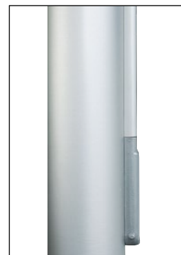
Schließklampe mit aufliegendem Deckel, sperrbar mit Steckzylinder