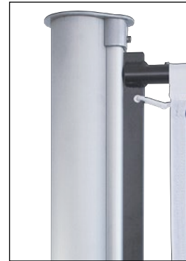
Mastkopf mit Langschlitten, Teleskopausleger