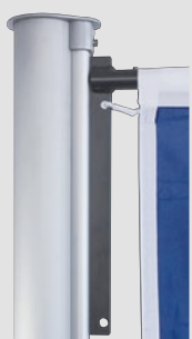
Mastkopf mit Langschlitten, Teleskopausleger